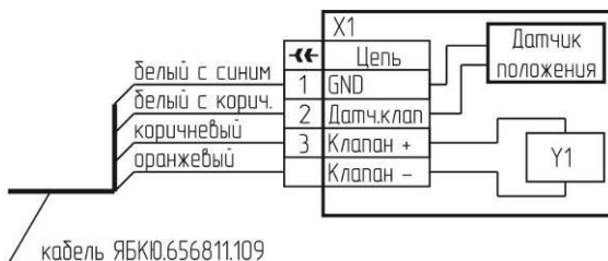
б) с разъемом BG5NO3000-UL